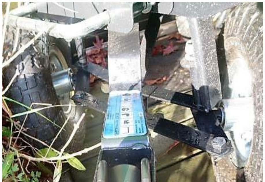
Frisch lackiert und neu verschmutzt

Hei, Pinsel und Farbe – „Oh, wie wohl ist mir am A-abend ...“